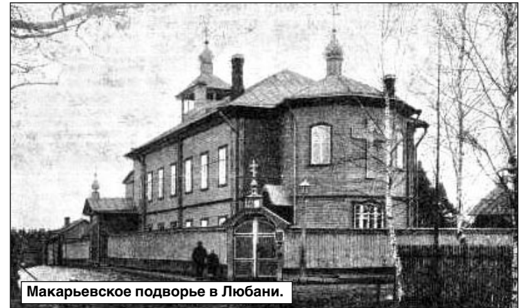
Макарьевское подворье в Любани.