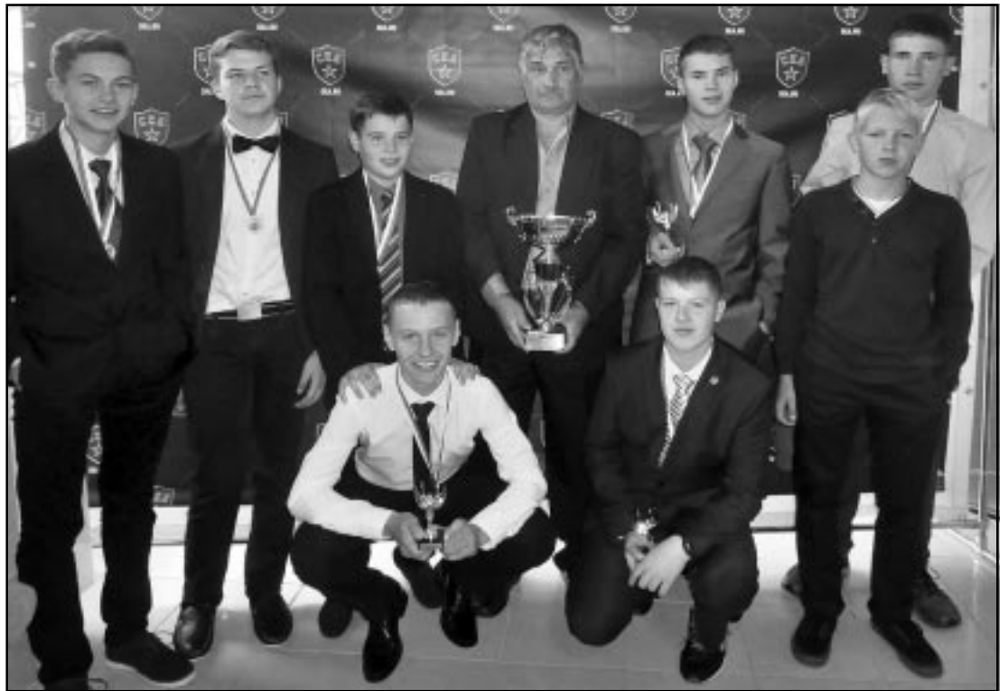
Несмотря на то что до зимы еще далеко, в Ленинградской области уже стартовал хоккейный сезон. Первым его официальным мероприятием стало подведение итогов сезона прошлого. Приятно, что на церемонии награждения лучших юных хоккеистов 47 региона чаще других звучали тосненские имена.