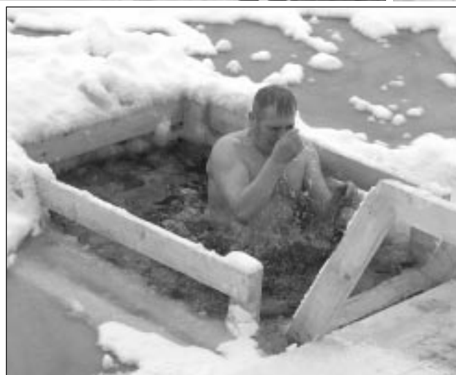
Крещение в городе Любани в прошлом году.

К сведению прихожан. Освящение воды в Тосненском храме Казанской иконы Божией Матери начнется в сочельник, 18 января, и будет проходить до 27 января.