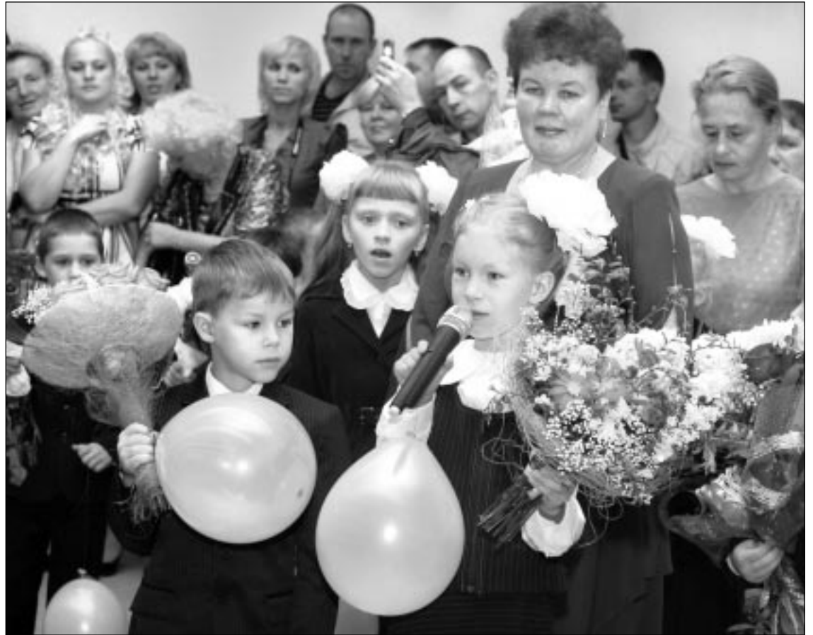
Губернатор Ленинградской области Валерий Сердюков внес на рассмотрение в Законодательное собрание изменения в действующие областные законы, касающиеся поддержки семьи и материнства.

"Вокруг задачи развития человеческого потенциала России мы должны выстроить нашу социальную, экономическую, миграционную, гуманитарную, культурно-просветительскую, экологическую, законодательную политику. И не на период "от выборов до выборов", а на долгосрочную, в полном смысле – историческую перспективу", – подчеркивает глава Правительства.